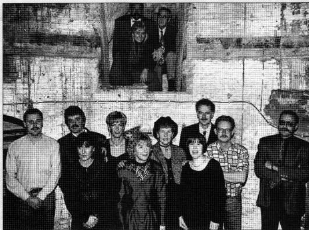
De medewerkers even bijeen in een van de koepels.