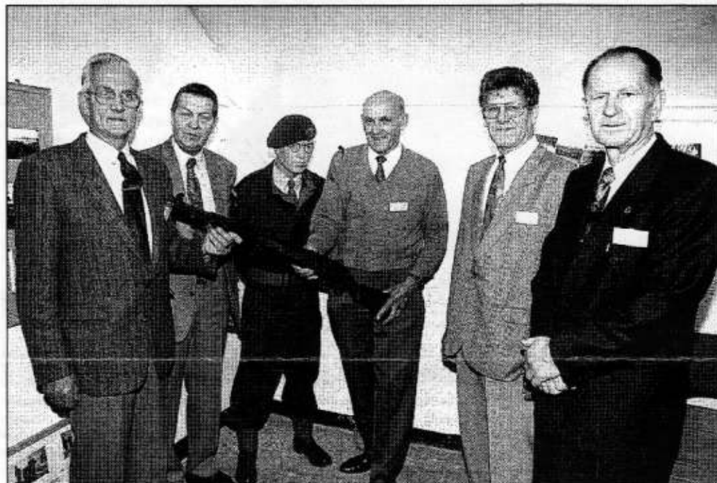
Museummedewerkers hadden voor een verrassing gezorgd.