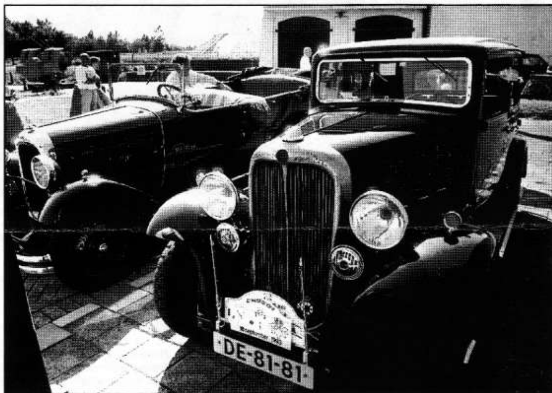
De perfect onderhouden Citroëns waren enkele uren te bezichtigen op het voorterrein van het Fort.