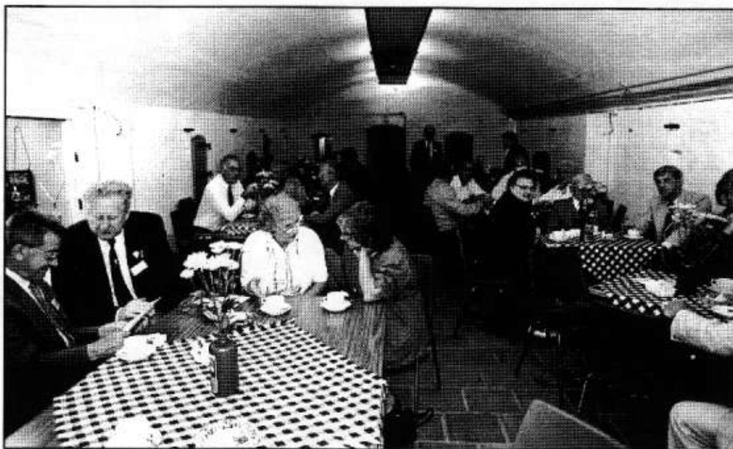
In totaal kwamen er zaterdag 12 juni 109 personen naar de reünie voor oud-gedienden van de Kon. Marine en het Korps Mariniers. Het werd een groot succes. Aan het na afloop door de Werkgroep georganiseerde etentje in het Chinees-Indisch restaurant 'Ocean City' hebben totaal 53 personen deelgenomen. Het werd een feestelijke afsluiting van een bijzondere dag.

De Marva's moesten zich houden aan bepaalde voorschriften wat het uiterlijk betreft. 'Ons haar moest kort zijn. We mochten wel wat make-up gebruiken, maar zoals tegenwoordig, nee dat was voor ons verbo-