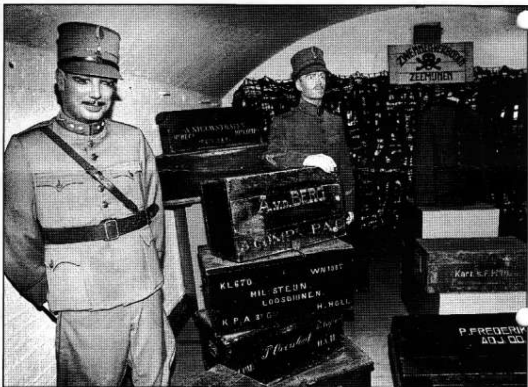
Oud-gedienden kunnen in het museum ook vele tastbare herinneringen aan de tijd van toen terugvinden.

De soldaten moesten vooral leren de kanonnen, die in de duinen stonden opgesteld, te bedienen. 'Maar voor het gewerschieten moesten we naar de schietbaan in Monster lopen. We hadden een heel sportieve luitenant, een echte sportman. Die liet ons de helft van die 8 km in marstempo afleggen...'