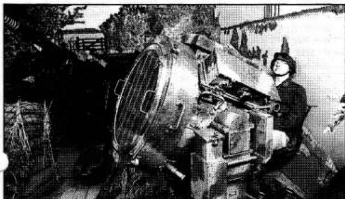
Als het museum in het voorjaar weer opengaat, zullen er weer meer diorama's te bezichtigen zijn.

Zo zal het aantal diorama's worden uitgebreid. De Kamers